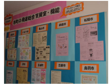
各市町のパンフレット

各市町の役所の窓口に、保健・福祉・教育がチームとなったワンストップ窓口の設置を目指しています。このような窓口をあすなる学園の外来に掲示して紹介しています。「私の市はここにあるから安心」「市町はどこに行けばいいの？」など、それぞれの市町での相談支援を求める声が聞かれます。三重県のどこに住んでも支援が受けられるよう、あすなる学園は、各市町と協働していきます。皆様のご意見、ご要望をお聞かせください。