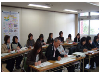
アドバイザーミニ学会の様子

あすなる学園では、各市町の核となる人材を育成するために、保健師・保育士・教員の方の研修を1年間受け入れています。研修後は、「みえ発達障がい支援システムアドバイザー」として、各市町の発達総合支援室・機能等で活躍されています。現在16市町30名です。研修後もあすなる学園は、ミニ学会(事例検討会や取り組み報告会)の開催、子育て支援ストレスマネージャーの育成など、更なるスキルアップ研修を計画し、市町での活躍を応援しています。