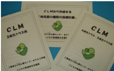
CLM・幼児期の個別の指導計画

子どもが毎日通う保育所・幼稚園で、適切な支援が受けられるように、あすなる学園が開発した「CLM(チェック・リスト・in 三重)」と「幼児期の個別の指導計画」を今年度、新たに改訂しました。これらについて、夏の研修会を企画したところ、多数の申し込みをいただきました。ありがとうございます。定員以上の申し込みの要望にお応えするため、夏以降の研修会の企画も考えています。ぜひ、ご参加ください。