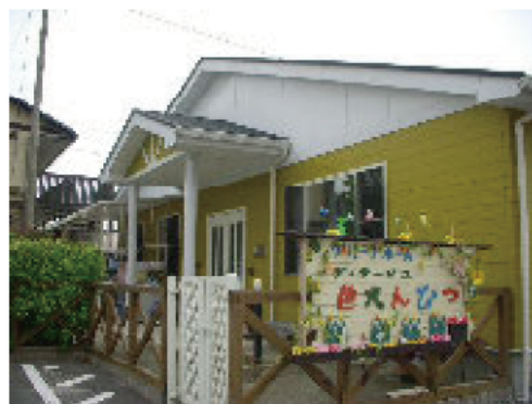
手作りの看板・・・ちょっと派手かな？

そして職員も色々な個性の中に信念を もって認知症介護に関わっていけるよう 日々頑張ってます！