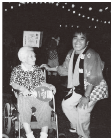
盆踊り大会 地域の方も 気軽に声を掛けてくれます

色えんぴつグループホーム・鈴鹿は「いつでも、どこでも、わたしらしく」をモットーに利用者と職員が家族として暮らしていきたいと思っています。