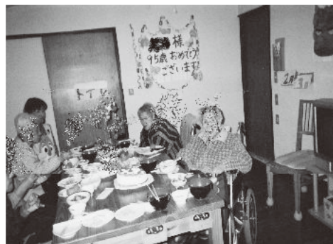
ご家族も一緒に入居者T様、95歳のお誕生日をホームで祝いました。