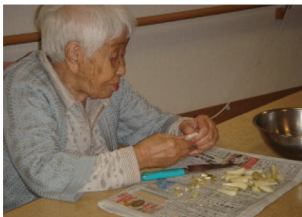
「らっきょう早く食べたいな。」