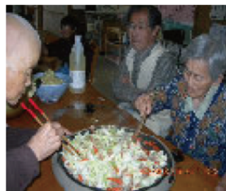
焼きそば作りに挑戦中

洗濯物を干したり、片付けたり、食事を 作ったり、後片付けをしたり、皆でおやつを 作ったりしています。