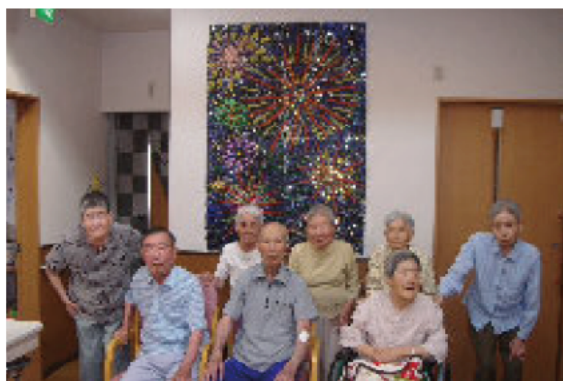
部屋の中にも大きな花火が咲きました

『季節を感じていただく』ということに重点をおいてます お花見やなばなの里へコスモスを見に行ったり、ちょっと夜更かし？して ホタルを見に行ったり・・・中庭で花火大会や餅つきもしました。