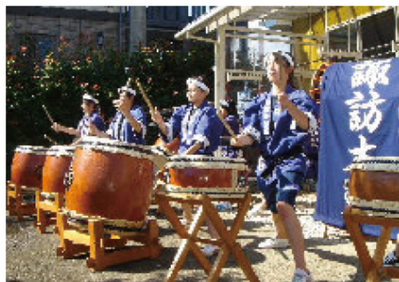
浜田子供会の諏訪太鼓 力強い演奏に感動しました

ご家族には毎月1度個々でのお手紙に加えお電話で密に連絡・相談をさせて頂いています。