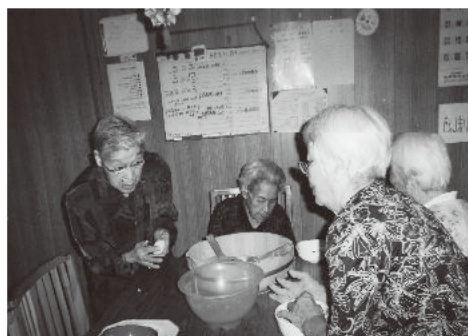
調理風景 おすし作りです