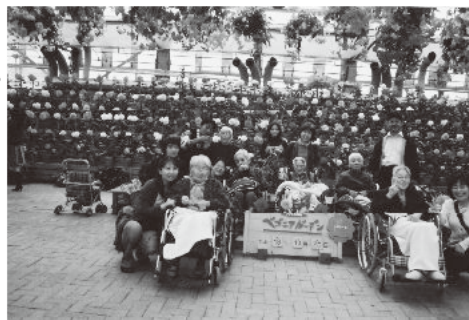
御家族と共になばなの里へ出かけ 満開のベゴニアに大満足