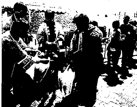
H25 春期緑化運動 鈴鹿市植木振興会

※その他は、繰越金で翌年度に緑の募金が入金されるまでの期間、春期緑化運動経費等に使用します。