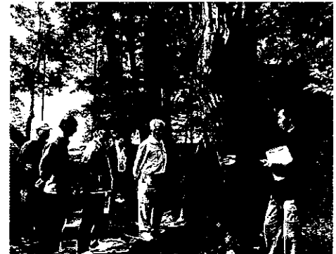
H24 緑地等適正管理事業 桑名市多度町