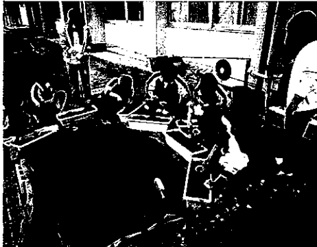
H25 春期緑化運動 志摩市立安乗中学校