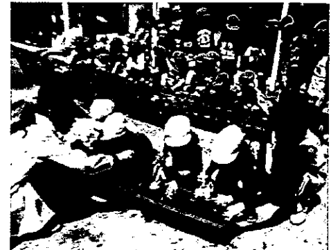
H25 春期緑化運動 伊勢市立保育所ゆりかご園