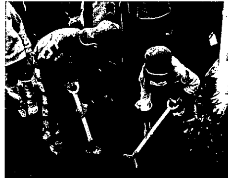
H25 春期緑化運動 津市立榑原幼稚園