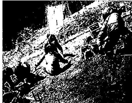
H24 緑の募金交付事業 大台町 宮川林業研究会