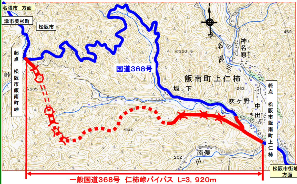
現道の未改良区間