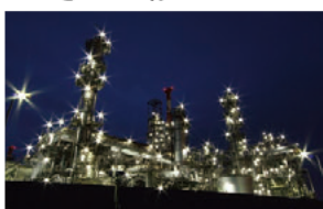
四日市コンビナートの夜景