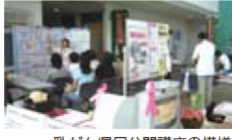
乳がん県民公開講座の模様

「三重県がん対策戦略プラン」では、四つの対策が掲げられ、その一つ「がんと共に生きる」が「緩和ケア」にあたると思いますが、緩和ケアについてはほとんど記載がありません。