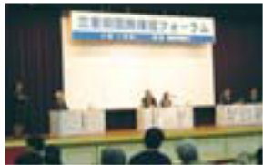
三重県国民保護フォーラム