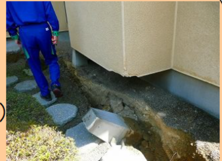
(現地での家屋調査)