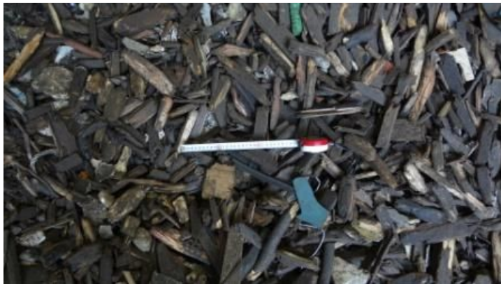
対象となる混合廃棄物

放射性セシウムとは、セシウム134、セシウム137の合計のことです。 不検出とは、検出下限値未満であったことを表します。( )内は検出下限値を示します。