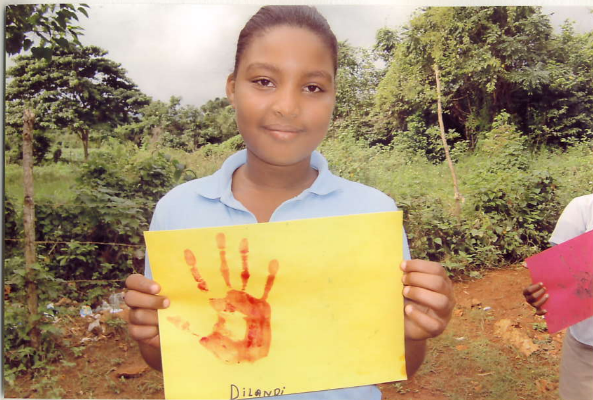
ディランディさん