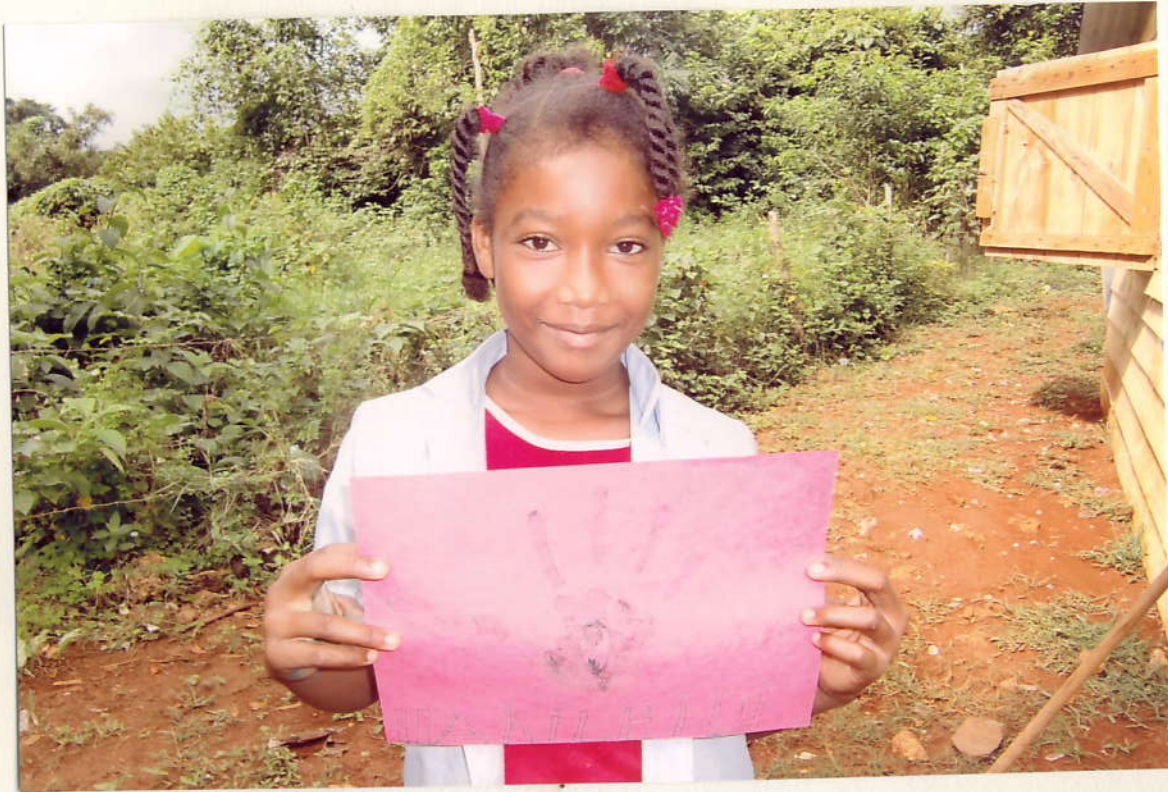
ツヤイレイティさん