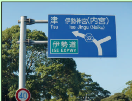
主要地方道伊勢磯部線 （伊勢市宇治館町内、県営総合競技場付近）