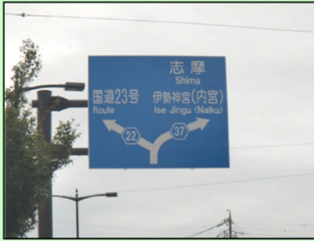
主要地方道伊勢南島線（御幸道路） （伊勢市倭町内）