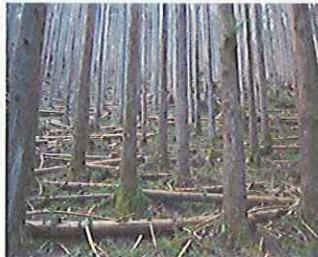
災害後の林内 (熊野市新鹿地区)