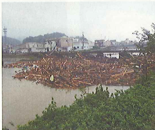
JR鉄橋にかかる流木の状況(熊野市井戸川)