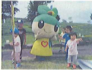
イベント開催(大分県)