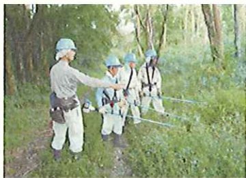
新規就業者の研修(岡山県)