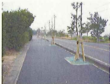
美しい並木道の再生(愛知県)