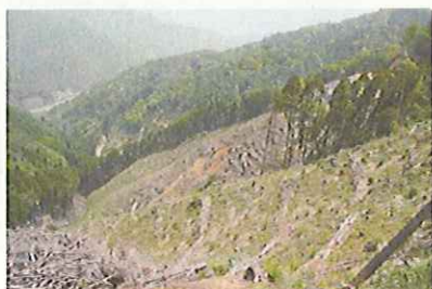
造林放棄地の植林(大分県)