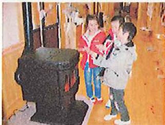
ペレットストーブ導入支援(愛媛県)