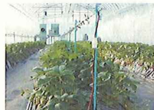
木質バイオマス等利用による園芸施設の開発(福島県)