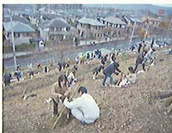
住民による法面緑化(兵庫県)