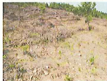
広葉樹植栽(福岡県)