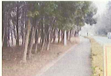
通学路の安全確保(栃木県)