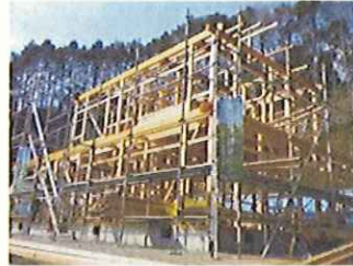
木造住宅普及(柱の提供)(愛媛県)