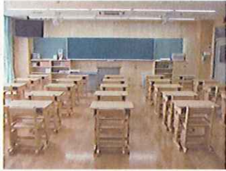
公共施設木造化(愛知県)