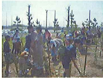
市民植樹祭(愛知県)