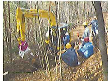
事業者の技術力の向上(長野県)