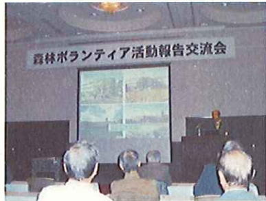
活動交流会(熊本県)