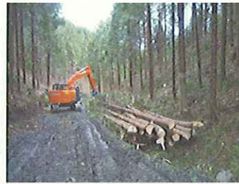
(間伐材搬出の作業路開設(栃木県))