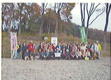
税使途箇所のバスツアー(栃木県)