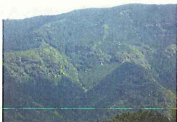
公有林化支援(佐賀県)