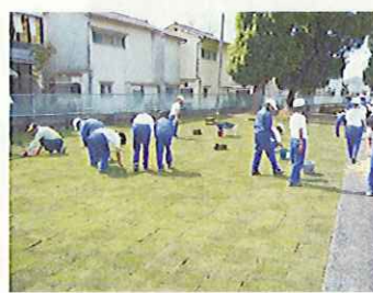
学校の芝生化(兵庫県)