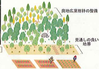
人と野生動物が共存できる森林の育成(兵庫県)