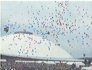
フェスタ開催(山口県)