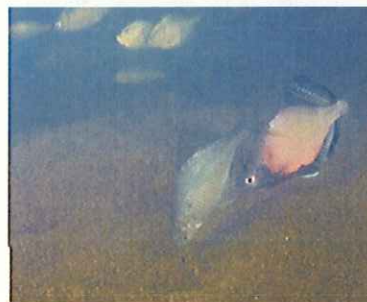
野生生物の保護管理、里地や身近な水辺の保全(岐阜県)