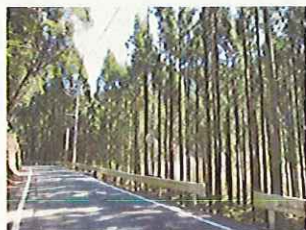
公道沿いの森林整備(愛知県)