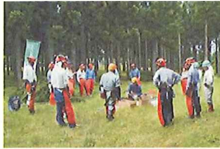
技術講習会(富山県)