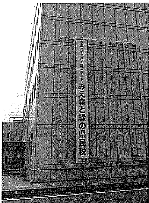
懸垂幕の掲出状況(四日市庁舎)