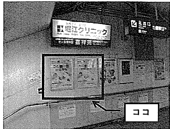
駅でのポスター掲出状況（松阪駅） （H26. 3. 4～3. 14）