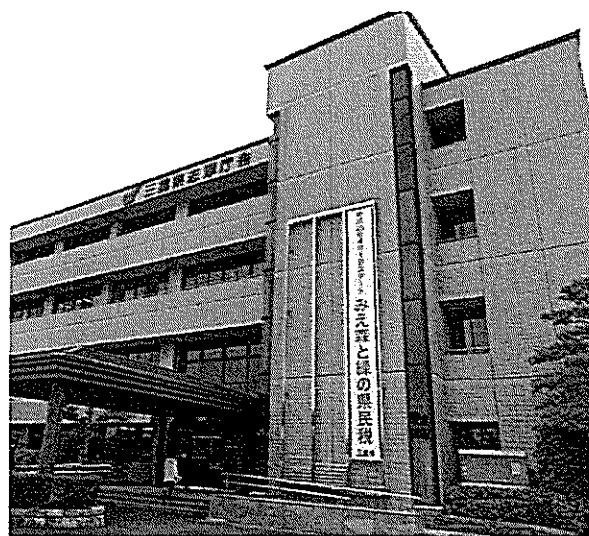
懸垂幕の掲出状況(志摩庁舎)