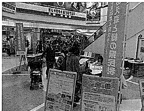
ショッピングセンター(イオンモール鈴鹿)でのPR状況 (H25.12.14)