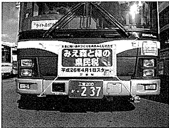
バスマスク広告（H26. 1. 13～3. 12）