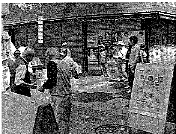
くわな軽トラ市(桑名市)でのPR状況 (H25.5.25)