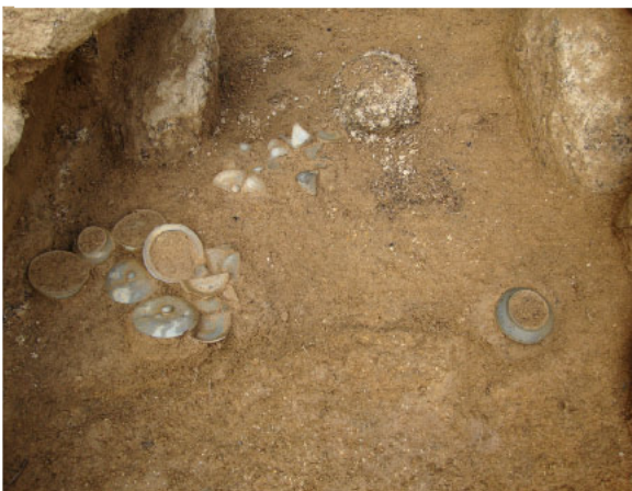
1号墳羨道部 土器出土状況