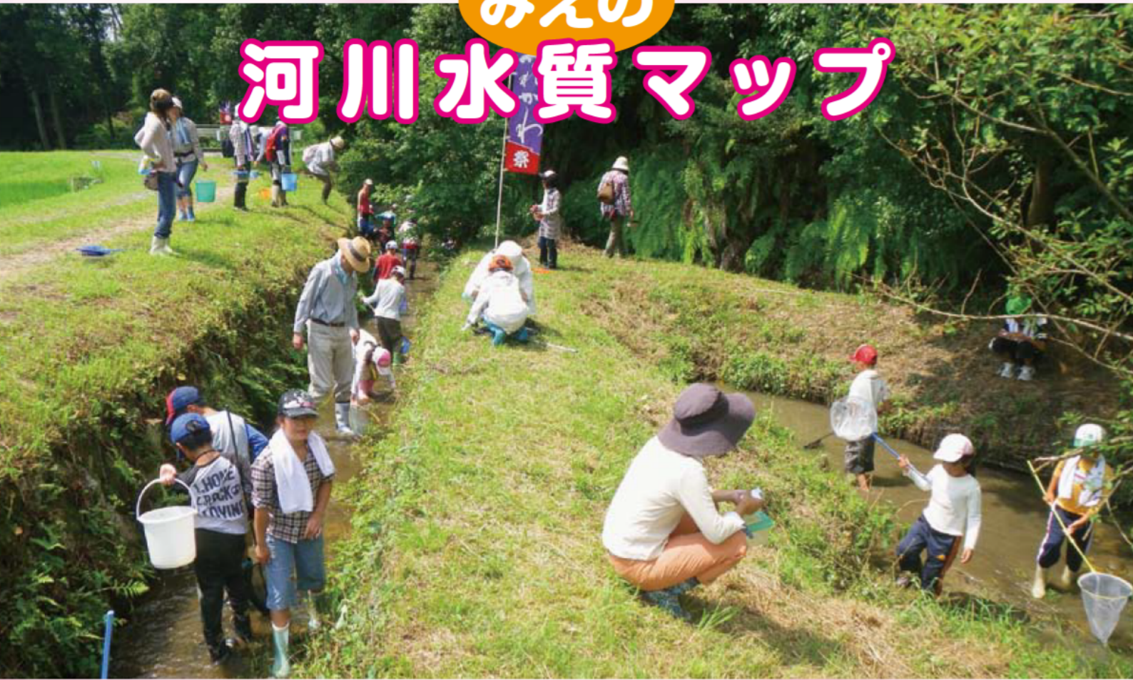
水土里ネットかがわ(嘉例川)