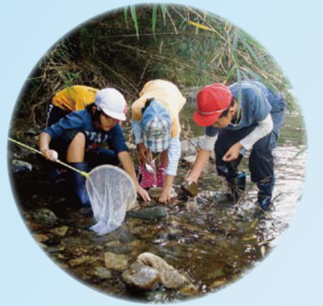
津市立雲林院小学校（安濃川）