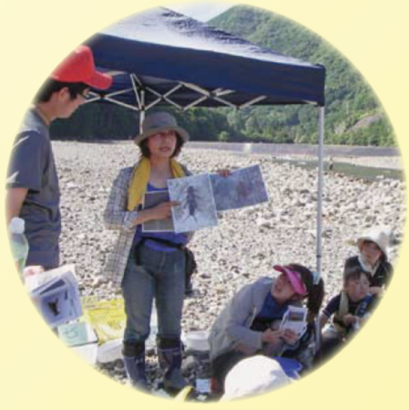
NPO法人ふるさと企画舎（銚子川）