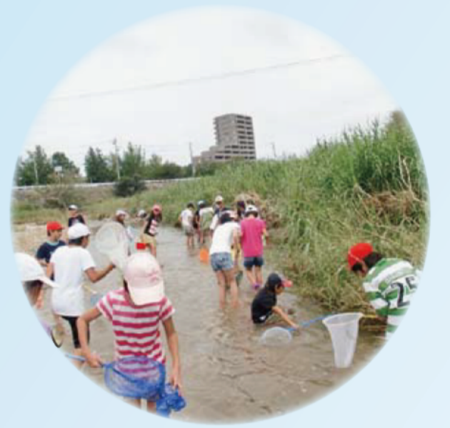
松阪市立松江小学校（阪内川）