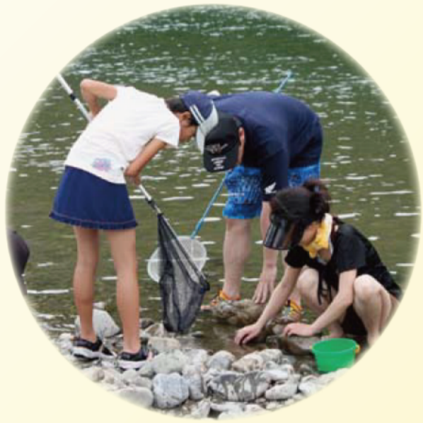
生活協同組合コープみえ（宮川）