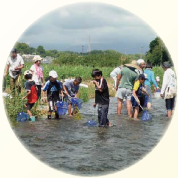
内部地区社会福祉協議会（内部川）