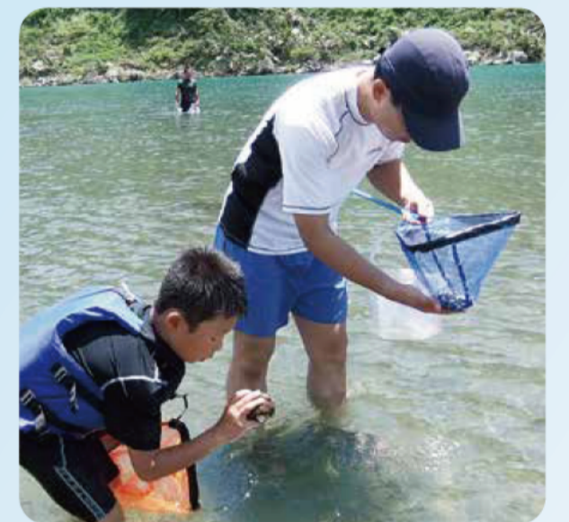
生活協同組合コープみえ