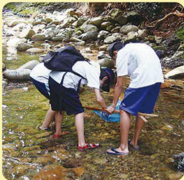
尾鷲市立尾鷲中学校