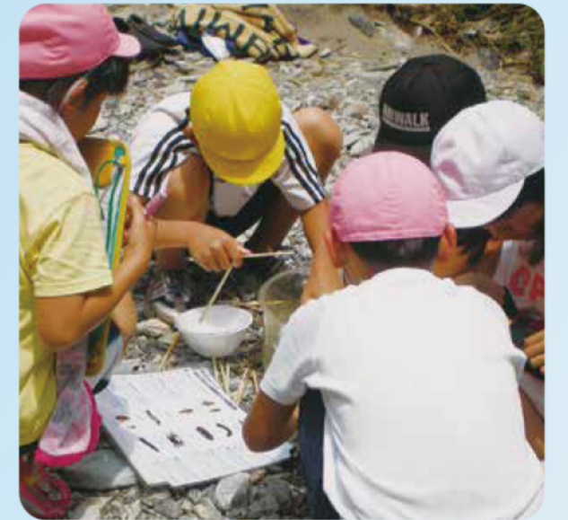
松阪市立粥見小学校