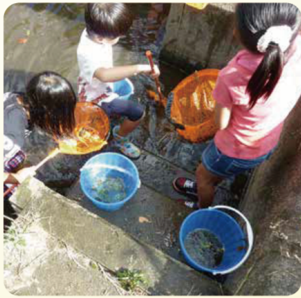
三郷の土と水を守る会