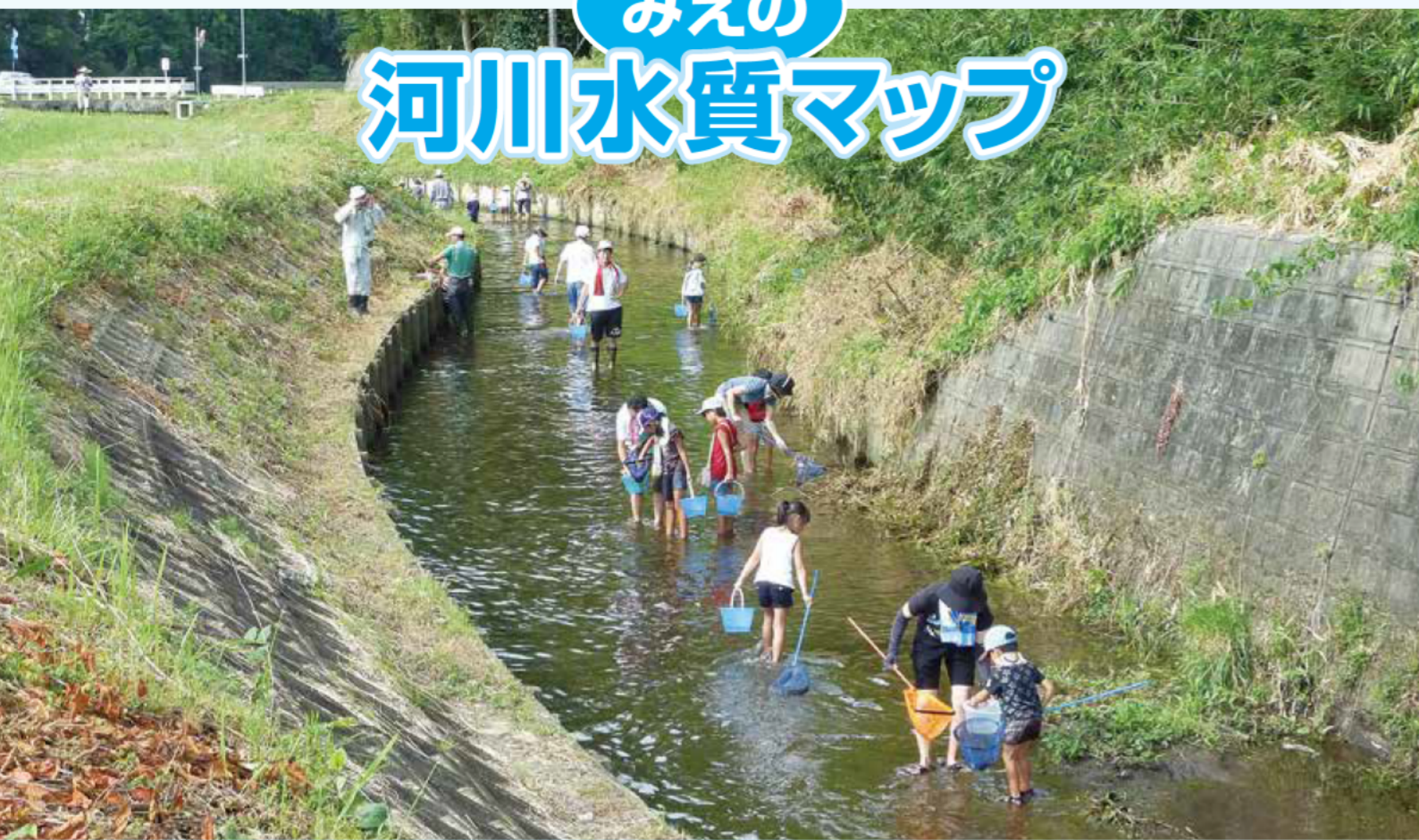
三郷の土と水を守る会(汁谷川)