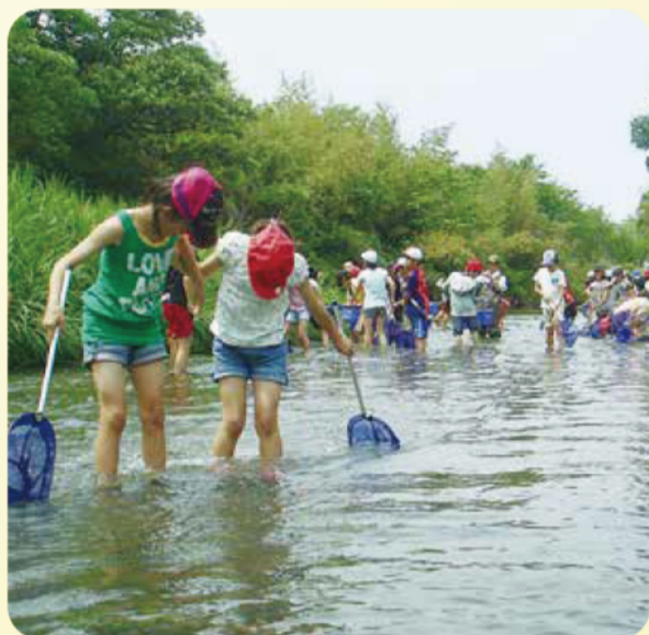
むらおこし・さいくう祓川(斎宮小学校)