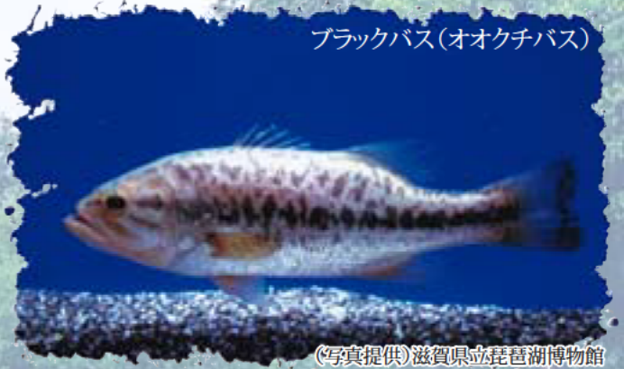
ブラックバス(オオクチバス)