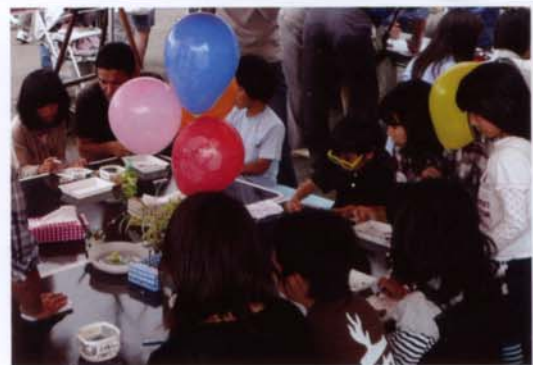
科学体験コーナー「土から絵の具を作ろう」

今後とも、地域に開かれた農業機関を目指し、県民や地域の皆さまと触れ合える機会などをつうじて、積極的に情報発信していきます。