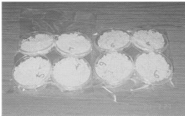
写真-1 真空凍結乾燥後

真空凍結乾燥後は写真-1、調理後の状況は写真-2のとおりで、ピラフに似た食感であった。真空マイクロ波加熱処理を行ったものは、真空凍結乾燥処理に比較して調理に時間を要し、芯が残っていたため食感が劣った。また、どちらの処理米の場合も熱湯の量により食感が大きく変わる上、注ぐ熱湯の量が少ないと、放置している間に温度が低下し調理が不十分となる欠点が見られた。従って、できるだけ少なく、より短時間で調理できる加工法の検討が必要である。なお、同じ調理方法でも、調味液の種類により、色、風味に変化をつけることが可能である。