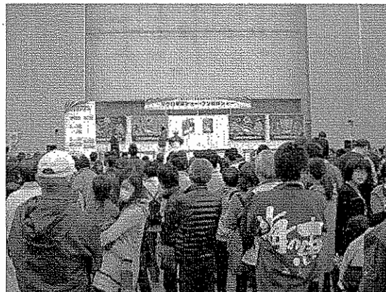
マグロ・ブリ解体ショー