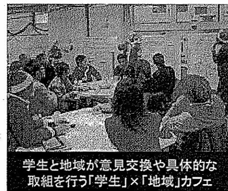
学生と地域が意見交換や具体的な取組を行う「学生」×「地域」カフェ

県内高等教育機関と地域との一層の連携や教員・学生の地域活動への積極的な参画を促進するため、学生と地域が意見交換や具体的な取組を行う「学生」×「地域」カフェや取組事例のコンテスト、シンポジウムなど、学生に地域活動へ参画する場や関心を高める機会を提供するとともに、仕組みの構築に向けた取組を進めます。