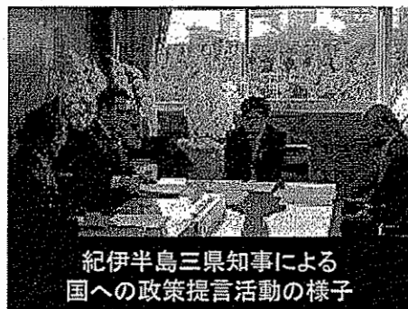
紀伊半島三県知事による国への政策提言活動の様子

全国知事会や関係府県等のさまざまな主体と連携し、地方分権改革や紀伊半島地域の振興、伊勢湾の再生など、多様な課題の解決に向けて取り組みます。