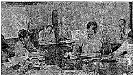
県民の皆さんの参加のもと「新しい豊かさ協創プロジェクト」を推進

「三重県経営戦略会議」や県民の皆さんの参画のもと進める「新しい豊かさ協創プロジェクト推進会議」などの意見等を踏まえ、「みえ県民カビジョン」の着実な進行管理を図ります。