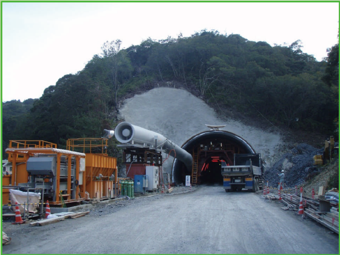
<トンネル掘削状況> 写真は、終点側（南伊勢町側） 坑口付近から撮影した状況です。