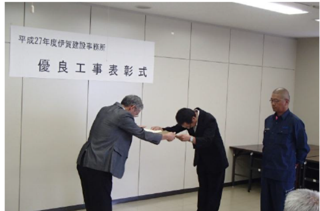
【株式会社廣嶋組 様】