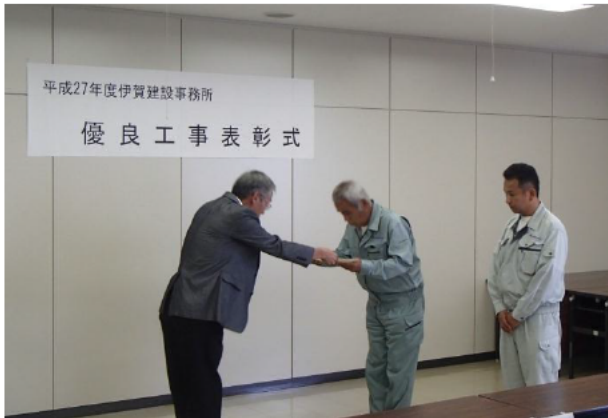
【株式会社西山建設 様】