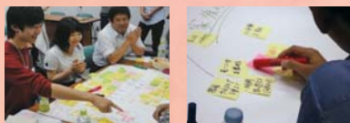
第1回のフューチャーセッションの様子