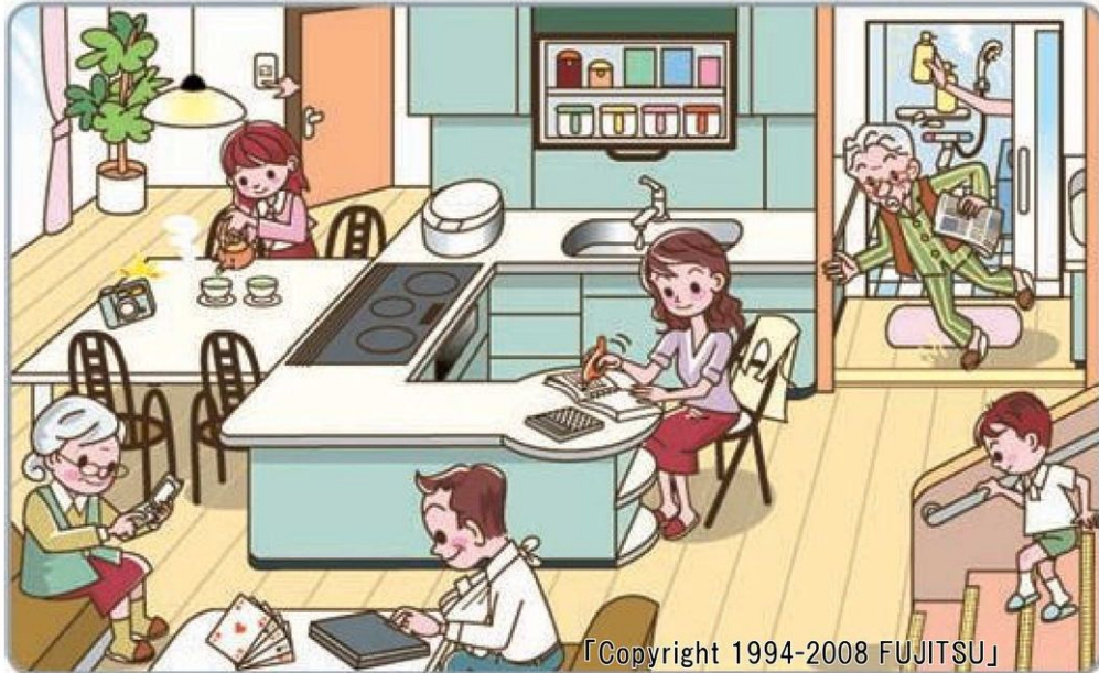
「Copyright 1994-2008 FUJITSU」