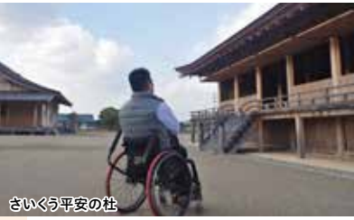
さいくう平安の杜

齋宮とは… 天皇に代わって伊勢神宮に仕えた齋王がいた宮殿。東西約2km、南北約700mの範囲に100棟以上の建物が建ち、500人以上の人々が暮らしていたと考えられている。