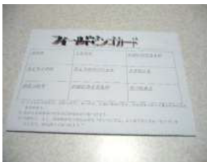
フィールドビンゴのカード(手作り)