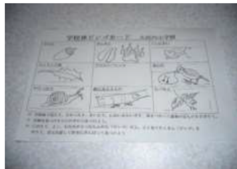
フィールドビンゴのカード(大河内小学校林)