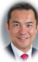
三重県知事 鈴木 英敬