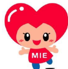
みえ次世代育成応援 ネットワーク キャラクター みっぶる