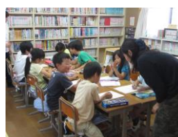
(草生っ子チャレンジタイム)