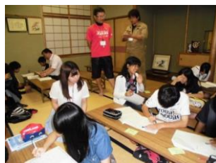
(南郊ナイトスクールの様子)