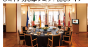
各国首脳が食事の際に使用した円卓をホテル内に展示