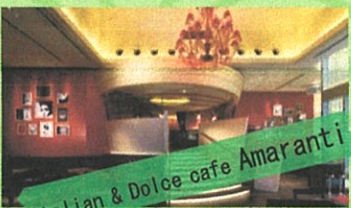
Italian & Dolce cafe Amaranti