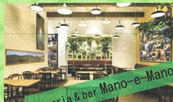
pizzeria & bar Mano-e-Mano