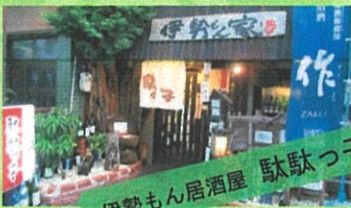
伊勢もん居酒屋 駄駄っ子