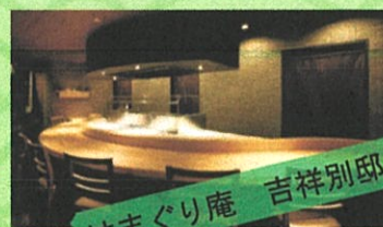
はまぐり庵 吉祥別邸