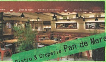
Bistro & Creperie Pan de Mere