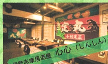
伊勢志摩居酒屋 心心(しんしん)