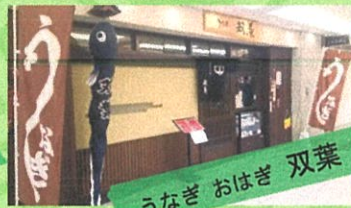
うなぎ おはぎ 双葉