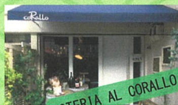
OSTERIA AL CORALLO