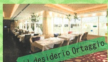
il desiderio Ortaggio