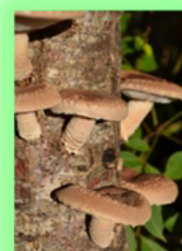
(シイタケ生産体験)