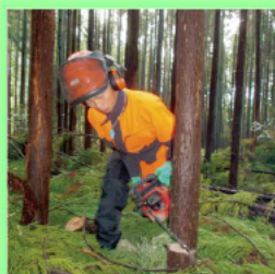
(チェーンソー基礎実習)