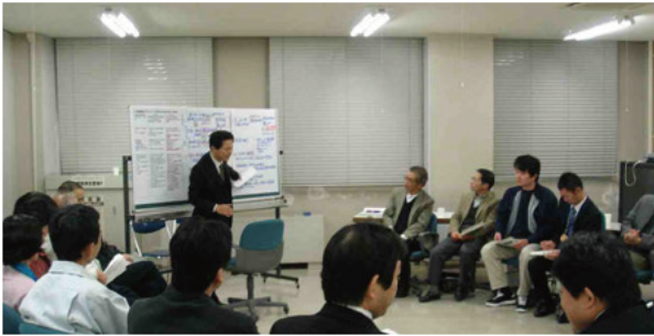
地域別会議の開催状況

今回は、紀南と紀北のそれぞれの地区のメンバーが集まりこれからの活動について話し合いました。今回のニュースレターでは、各地域別会議の概要についてお伝えします。