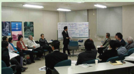
紀南地区のフリートークの状況