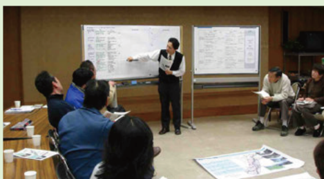
紀北地区のフリートークの状況