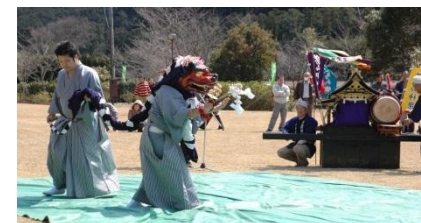
※写真は昨年の様子