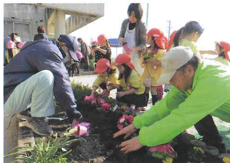
H27 緑の募金交付事業 明和町 町内保育所