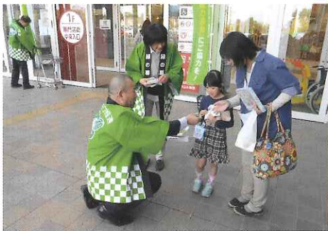
H28 春期緑化運動 三重県 街頭募金