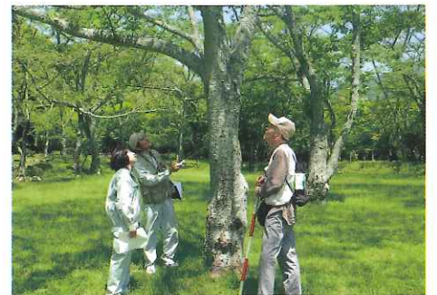
H27 緑地等適正管理事業 亀山市 正法寺山荘跡地サクラ健康診断