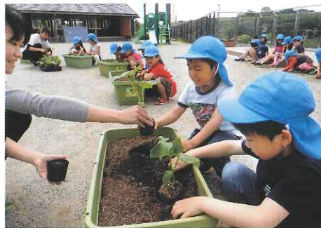
H28 春期緑化運動 志摩市 子育て支援センターわくわくの森