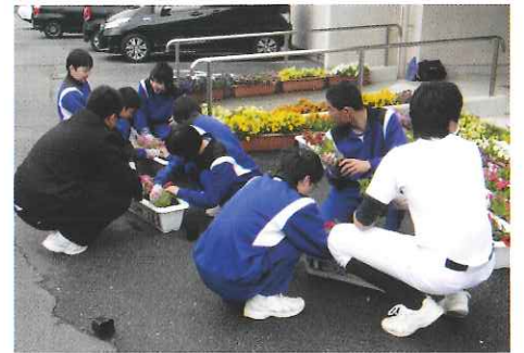
H28 春期緑化運動 南伊勢町 町内中学校