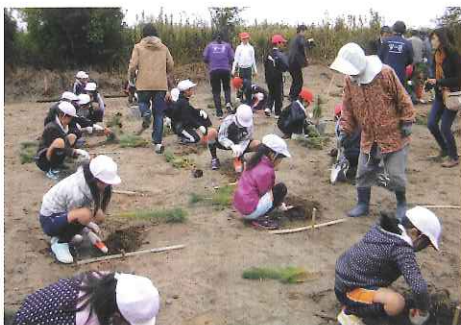
H27 緑の募金交付事業 伊勢市 今一色自治会 松植樹