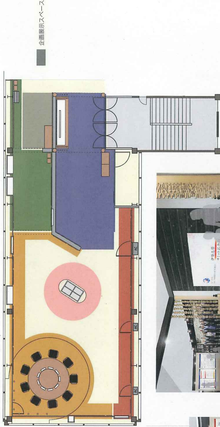
Zone-2 世界が三重に集う