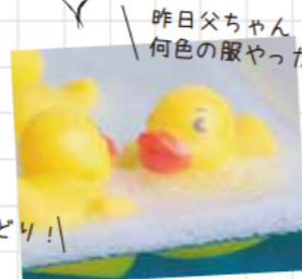
昨日父ちゃん 何色の服やった?

「何だったっけ?」をクイズで楽しく振り返る 思い出クイズinお風呂 お風呂の時間は、子どもとのコミュニケーションタイム。 昨日の晩ご飯のおかずや、車の中で一緒に歌った歌など... 楽しくクイズ形式で出し合って、振り返りながら遊んでいます。