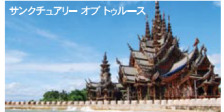
サンクチュアリー オプトゥールス 1981年より29年以上を費やし、未だ完成せず 現在も進められている木造建築物。高さ、幅は 約100m、総面積は約2,115平方メートル