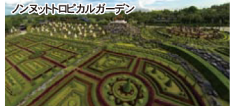
ノンヌットトロピカルガーデン 広大な敷地にヨーロッパンガーデン、盆栽などテーマの異なる庭園やラン園などを楽しめます。古典舞踊のショーもあり、タイ文化を体験できます。