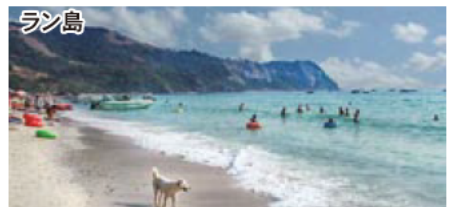
ラン島 パタヤから20分でいけるラン島はエメラルドグリーンに輝く海とサラサラの真っ白な砂浜が魅力です。ビーチパラソルの下でゆっくり過ごしてもよし、マリンスポーツでアクティブに楽しむもよし、ご自由にお過ごしください。

◆出発便は9月11日(月)深夜00時30分の為、セントレア集合は前日9月10日(日)の夜22時を予定しております。 ◆ゴルフプレイは、表面のゴルフ場のいずれかでキャディー・カート付き18ホールプレイとなります。