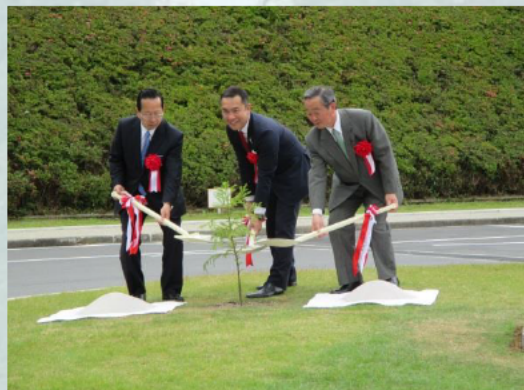
神宮スギの定植式

賢島駅前ロータリーのアイランドでは、記念館のオープンを記念し、首脳が伊勢神宮に記念植樹した神宮スギの定植式を行いました。 (志摩市によるモニュメント「波際の架け橋」の除幕式も行われました。)