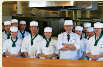
高校生レストラン(まごの店)