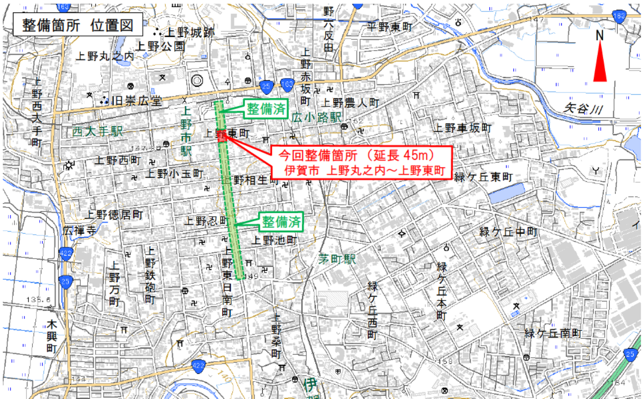
位置図は国土地理院ウェブサイト( http://maps.gsi.go.jp/ )データをもとに、三重県伊賀建設事務所により加工して作成

道路の拡幅 (右折レーン設置) 歩道、電線共同溝、 道路照明の設置などをおこないました。