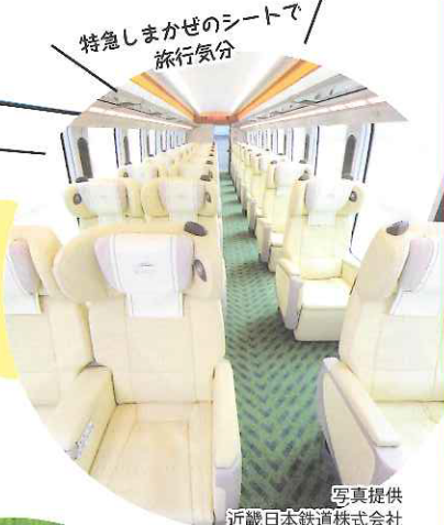
特急しまかぜのシートで旅行気分