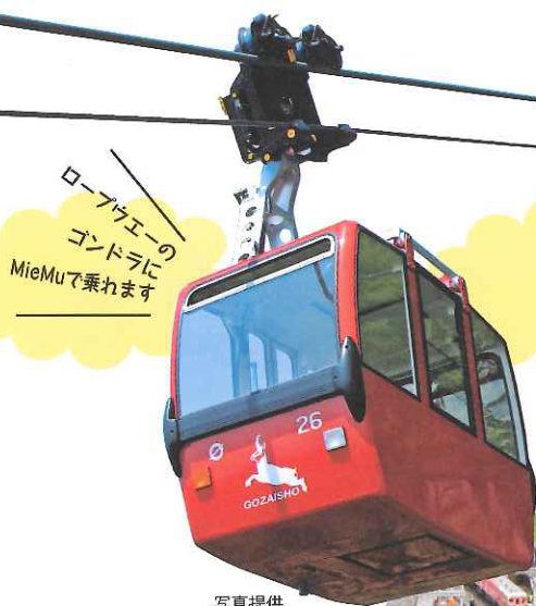
ロープウエーのゴンドラに MieMuで乗れます