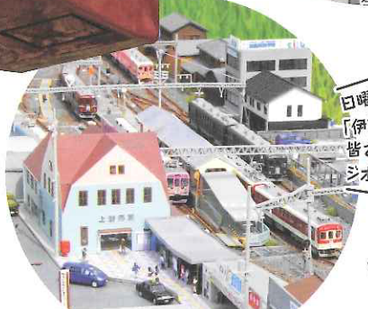
日曜日や祝日などに「伊賀線ジオラマ」の皆さんによるジオラマ運行日もあります