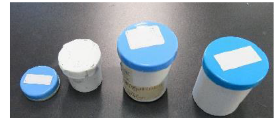
各種熱接触材料(サーマルグリース)

実使用環境に近い方法により候補材料を評価することで、根拠に基づいた実用的な材料選定が可能になった。この結果、製品の信頼性を向上させつつコストダウンできる見通しを得た。