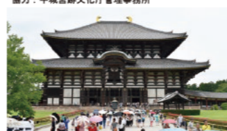
東大寺大仏殿 (奈良県)