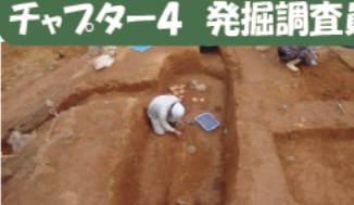
間無事古墳 (度会郡玉城町)