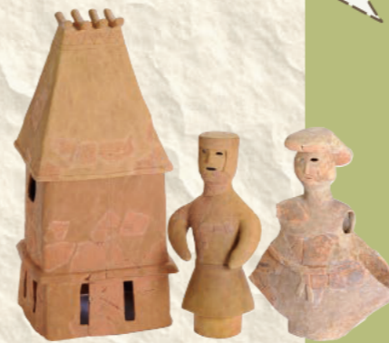
はにわ (鈴鹿市石薬師東古墳群)