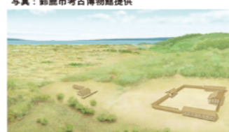
久留倍官衙遺跡 (四日市市)