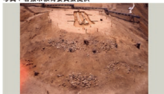
上椎ノ木1号墳 (亀山市)

00:01~ 皆さんは「お墓」というと、どのようなものを思い浮かべるでしょうか? お墓には、現代のお墓や、エジプトのピラミッドなど、様々な大きさや形がありますよね。今日は、日本の古墳時代のお墓をみていきましょう。