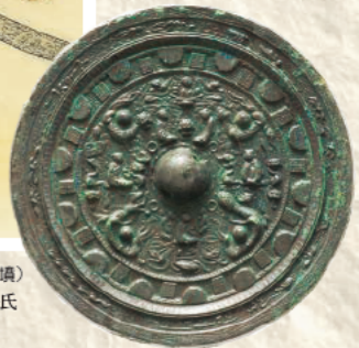
鏡 (龜山市井田川茶臼山古墳)