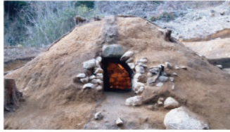
浅子谷古墳群 (伊賀市)