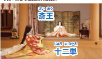
斎宮跡 (多気郡明和町)