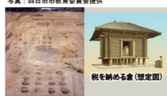
久留倍官衙遺跡 (四日市市)

09:55~ 710年、都は奈良県奈良市の平城京に遷されました。中国の都をまねて道路が基盤の目のように整えられています。