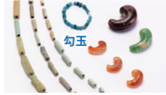
上椎ノ木1号墳 (亀山市)

03:53~ 亀山市にある上椎ノ木1号墳の中のようなすをみていきましょう。上椎ノ木1号墳は、丸い形の円墳です。盛り上げた土の上には、棺を納めるための穴があいていました。