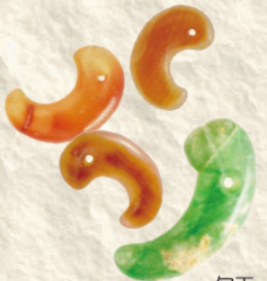
勾玉 (龜山市上椎ノ木1号墳)