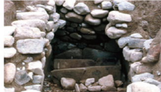
井田川茶臼山古墳 (亀山市)