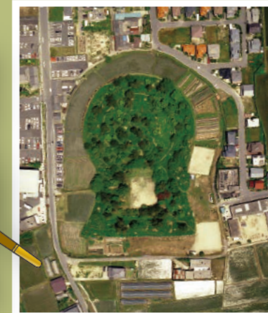
前方後円墳 (名張市馬塚古墳)