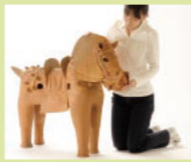
石薬師東古墳群 (鈴鹿市)

筒型、動物、人、家、盾など様々な形があります。古墳が神聖な場所であることを示すため、あるいは儀式の様子を再現するため、古墳のまわりに並べられたものです。