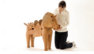
石薬師東古墳群 (鈴鹿市)