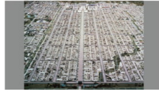
平城京 模型

08:05~ 石薬師東古墳群からみつかった馬の形をした埴輪には、鞍やあぶみなど、馬に乗るための道具も正確につくりこまれていました。