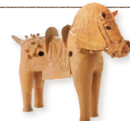
馬形埴輪 石薬師東古墳群 (鈴鹿市)