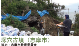
塚穴古墳 (志摩市) 協力: 志摩市教育委員会

19:46~ 私たちが暮らす三重県には、およそ14,000もの遺跡があります。遺跡というのは、昔の人のお墓や、昔の人が生活した場所のことです。遺跡を掘って、昔の人々がどのような暮らしをしていたのか調べることを、発掘調査といいます。