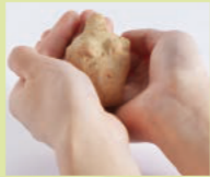
粥見井尻遺跡 (松阪市)

多くは女性を表現しており、手や足等が欠けた状態で出土することが多いことから、人の身代わりとしてわざと壊して、おまじないをしていたといわれています。