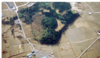
御墓山古墳 (伊賀市)