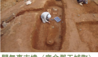
間無事古墳 (度会郡玉城町) 協力: 玉城町教育委員会