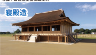
斎宮跡 (多気郡明和町)