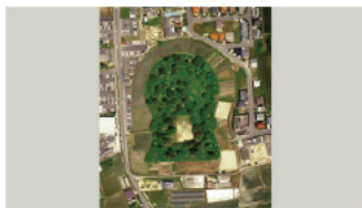
馬塚古墳 (名張市)