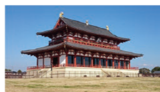
平城宮 大極殿 (復元) 協力: 平城宮跡文化庁管理事務所