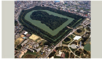
大仙 (仁徳陵) 古墳 (大阪府)