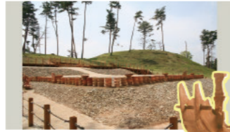
宝塚1号墳 (松阪市)