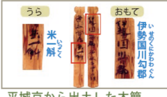
平城京から出土した木簡

13:12~ たくさんの柱で支えられた建物のあとが何棟もみつかりました。この建物は、税として納められた米を入れる倉であったと考えられます。