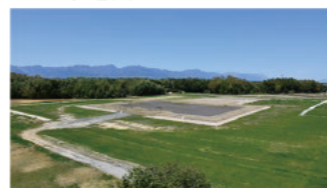
伊勢国分寺 (鈴鹿市)