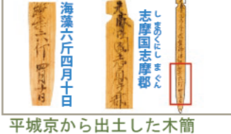
平城京から出土した木簡