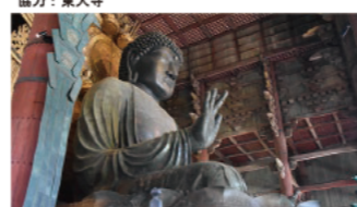
東大寺大仏 (奈良県) 協力: 東大寺