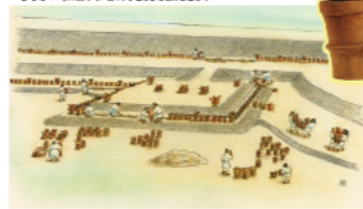
宝塚1号墳イラスト 作: 早川和子氏