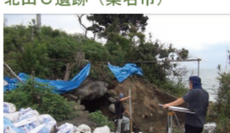
塚穴古墳 (志摩市) 協力: 志摩市教育委員会

14:08~ 三重県の地名が書かれた木簡です! 木簡のおもてには、伊勢国川勾郡と書かれています。伊勢国川勾郡とは、現在の、鈴鹿市の東部にあたります。木簡の裏には、米一斛と書かれています。