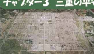
平安京 模型