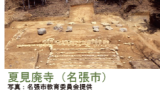
夏見廃寺 (名張市)