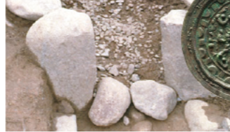
井田川茶臼山古墳 (亀山市)