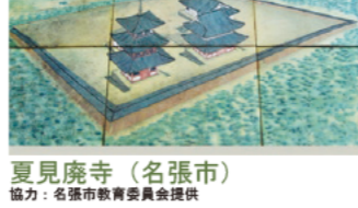
夏見廃寺 (名張市)

04:24~ これは古墳からみつかったもので、橙色や緑色の石は、勾玉です。勾玉は古墳時代のアクセサリーのひとつで、当時の人々は首飾りや腕輪として身につけていました。