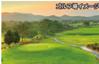
ゴルフ場イメージ

コース名からもイメージできる英国風リンクスを体感できる18ホール。ハンデキャップ18以下のゴルファーを対象にしたレイアウトの難しさや2つのパー6を擁するタフな距離設定が特徴。