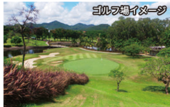
ゴルフ場イメージ