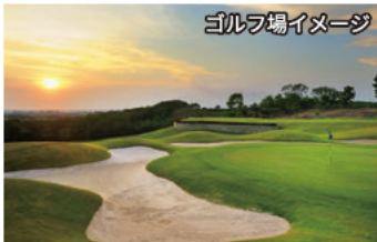
ゴルフ場イメージ

多くのトーナメント実績を持つ36ホールのチャンピオンコース。美しいレイアウトに絶妙なアンジュレーションを施した高速グリーンが特徴で、パタヤ市街や海を遙かに望む景観美でも知られる。