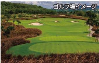
ゴルフ場イメージ

農園(プランテーション)だった場所に2008年オープンした戦略性と美しさを兼ね備えた27ホール。3つのホールのグリーンが一体となったトリプル・グリーンが名物。2009年ホンダLPGA開催コース。