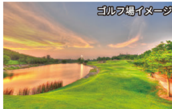
ゴルフ場イメージ