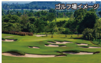
ゴルフ場イメージ