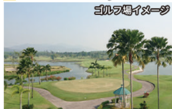
ゴルフ場イメージ