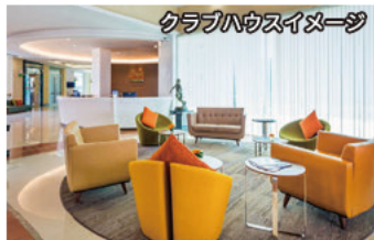
クラブハウスイメージ

2004年オープンの27ホール。全体的にフラットなレイアウトながら、ウォーターハザード(池)のプレッシャーを随所に散りばめ、うねりの強いトリッキーなグリーンも難敵となっている。