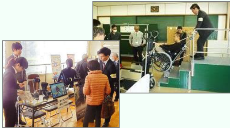
図1 県内出展者 ※【 】内は主な展示品

出展者からは「介護専門職の方の意見を聞くことができ有意義だった」「生の現場の声が聞けた」などの感想があり、出展者同士が交流する場面も多く見られました。