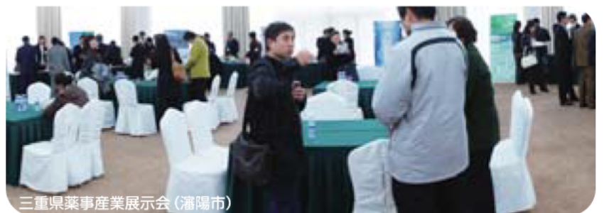
三重県薬事産業展示会（瀋陽市）