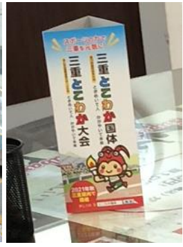
店舗等への 卓上POPの設置