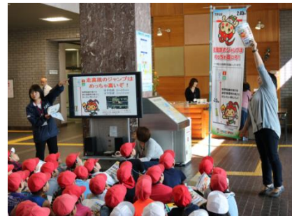
競技用具等を使用し、スポーツを体感