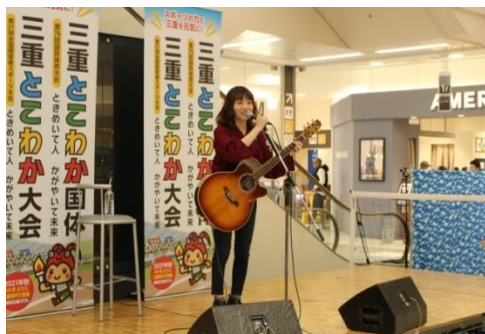
野田さんによるイメージソングの披露

平成30年3月17日（土）に、イオンモール鈴鹿で「とこわかスポチャレSUZUKA～2021へ！未来に響け～」を開催し、イメージソング「未来に響け」と、ダンスを初披露しました。