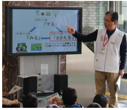
県庁見学での説明