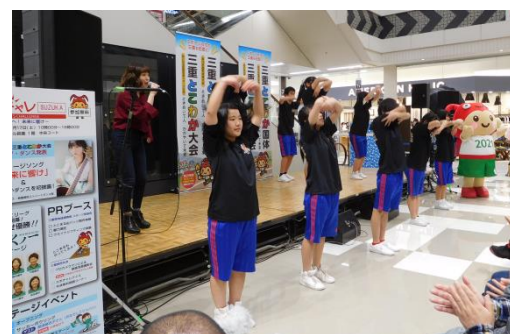
鈴鹿高校によるダンスの披露