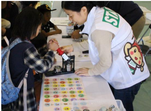
広報イベントでの缶バッジ作成