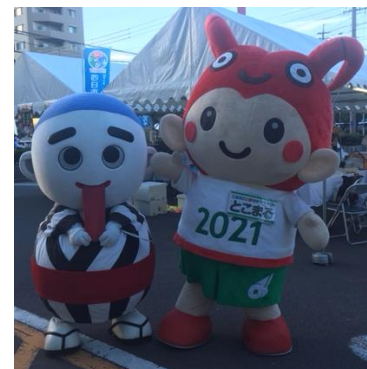
こにゅうどうくんと一緒に広報