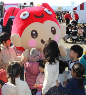
子ども達に囲まれるとこまる

また、市町やスポーツチーム等のマスコットキャラクターとも一緒に活動し、三重とわか国体の広報効果を高めています。