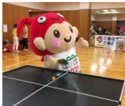
SSピンポンの競技を行うとこまる