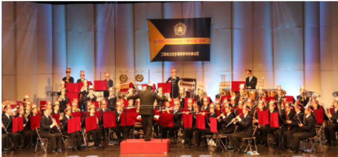
演奏する部員の皆さん

平成30年6月9日（土）に、吹奏楽部員が演奏とともに歌い、とこまると一緒にダンスを踊りました。