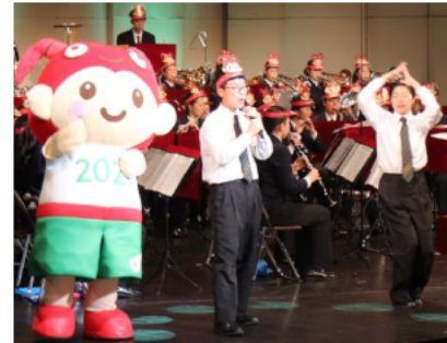
とこまると一緒にダンスを披露