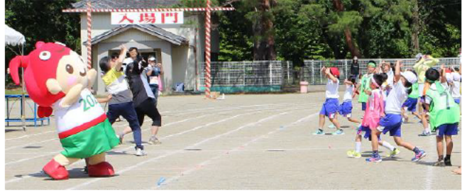
全校児童と地域の方もとこまるとダンス