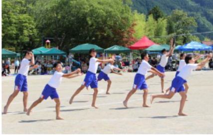
5・6年生によるダンスの披露

平成30年6月2日（土）に、松阪市立宮前小学校の5・6年生がダンスを披露し、その後、全校児童と地域の方も参加し、とこまると一緒に踊りました。