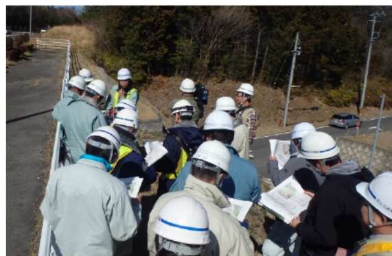
のり面の点検ポイントの説明