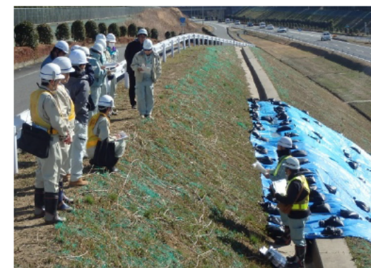
のり面で被災状況の説明