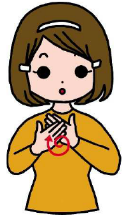
お だ じ 肩に