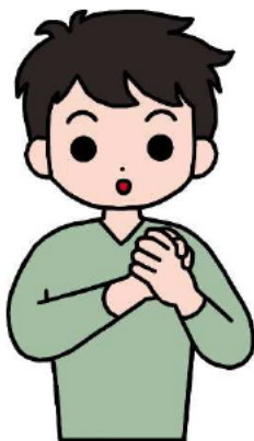
なかも 仲間・友だち