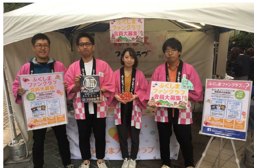
（六本木でのイベントにて）